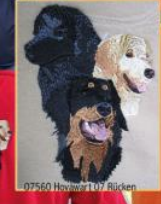
07560 Hovawart 107 Rücken